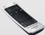
Télécommande tactile incluse